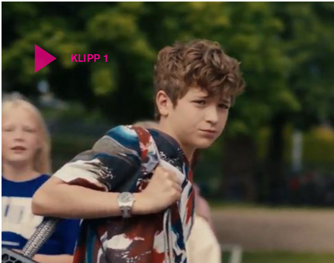
Klipp 1

förlåter Mina och visar henne att det är glädjen i att dansa som är det viktigaste, precis som hennes mormor alltid hävdade. Tillsammans ställer Markus och Mina upp med ett eget nummer i Mjosa Challenge. De vinner inte tävlingen, men blir uttagna att följa med på en dansresa till USA. Dessutom har Mina försonats med sin mamma och vunnit tillbaka det viktigaste, sin egen identitet.