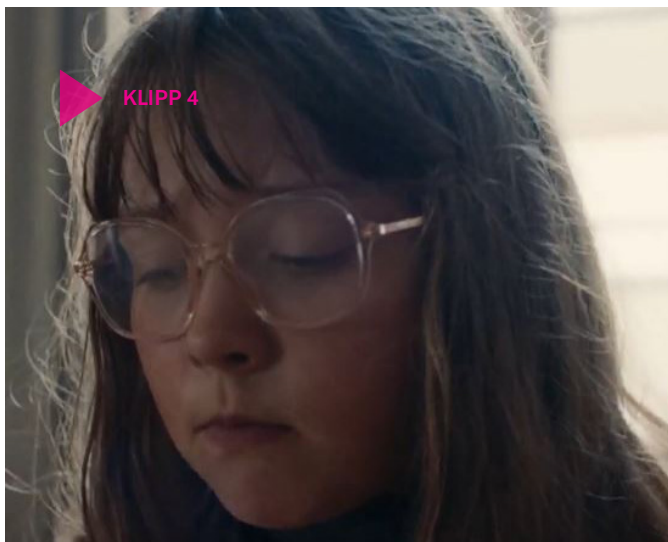
Klipp 4

knappt ett år. När filmen börjar är det skolstart i årskurs 7 och det sägs att danstävlingen ska äga rum på sommaren. Vi förstår också att det behövs mer än några veckor för att Mina ska hinna genomgå den kunskapsutveckling hon gör i dansen och alla dramatiska vändningar ska hinna äga rum.