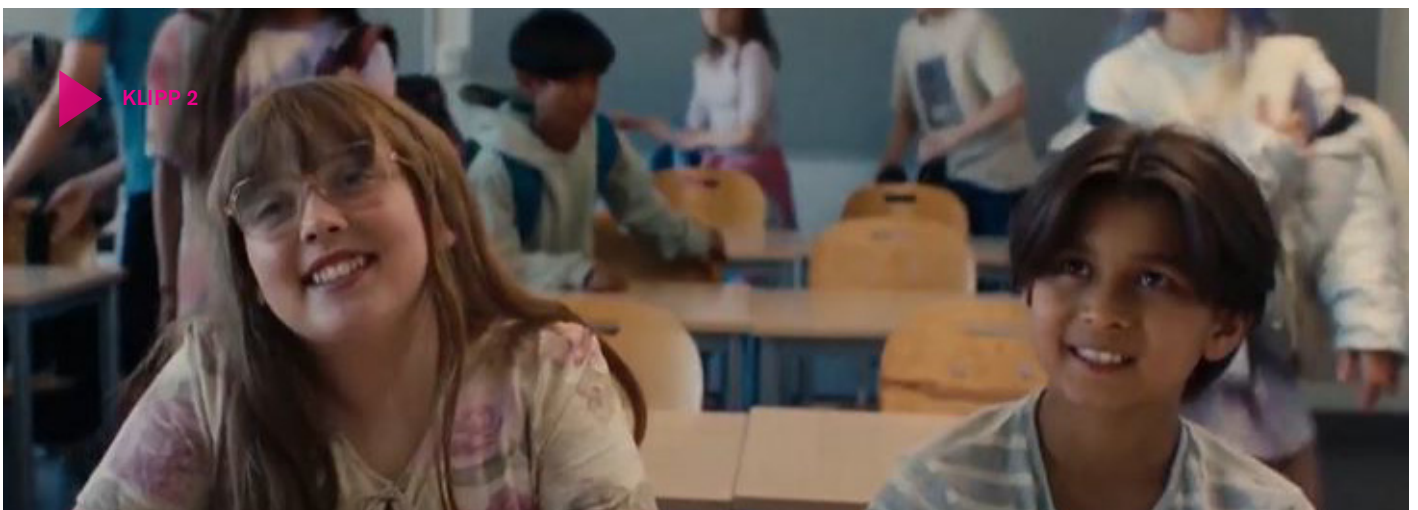
Klipp 2