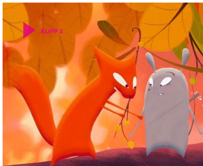
Klipp 3

När Yuku i början av filmen rör sig genom slottets salar får vi först följa henne nere på golvnivå, och se hur taket sträcker sig högt uppe ovanför oss ( grodperspektiv ). I nästa klipp ser vi henne kila som en liten prick över golvet, som om vi satt uppe i det höga taket, och såg henne långt därnere ( fågelperspektiv ). När vargen är på väg att sluka Yuku ser vi henne från ett särskilt kusligt perspektiv