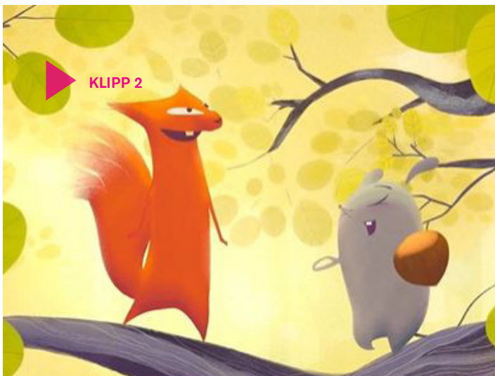
Klipp 2

musiken och sången. Det börjar med en ensam ukulele och byggs på med fler instrument (- som mest en hel myrorkester!). Vi får höra glada, svängiga sånger i olika genrer, som snabbt ”fastnar”. Men också en ensam cello, bastrumma eller Barrytonsaxofon som anger dova, varnande toner när det är som allra farligast.